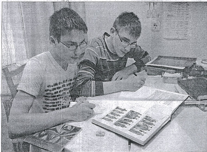
Заняткі на аддзяленні эстэтыкі і стылю ў аддзяленні.

модныя, як асновы дызайну, ландшафтны дызайн. Для самых творчых асоб працуе аддзяленне мастацкай творчасці, выпускнікі якога атрымліваюць спецыяльнасць кіраўніка самадзейнага творчага калектыву. Папулярнае ў моладзі рэпарцёрскае аддзяленне, дзе рыхтуюць рэпарцёраў для СМІ аг-